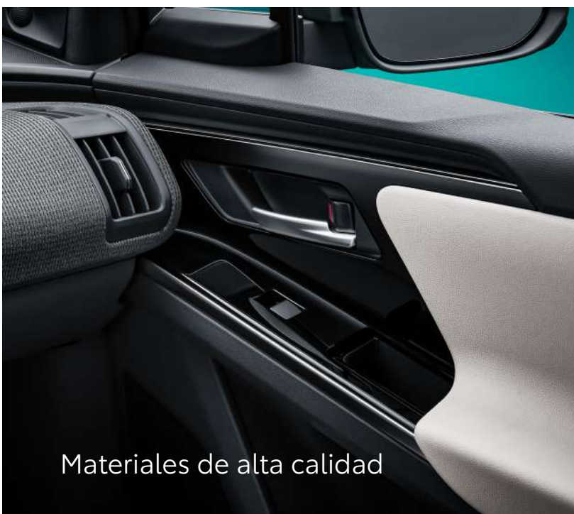
Materiales de alta calidad