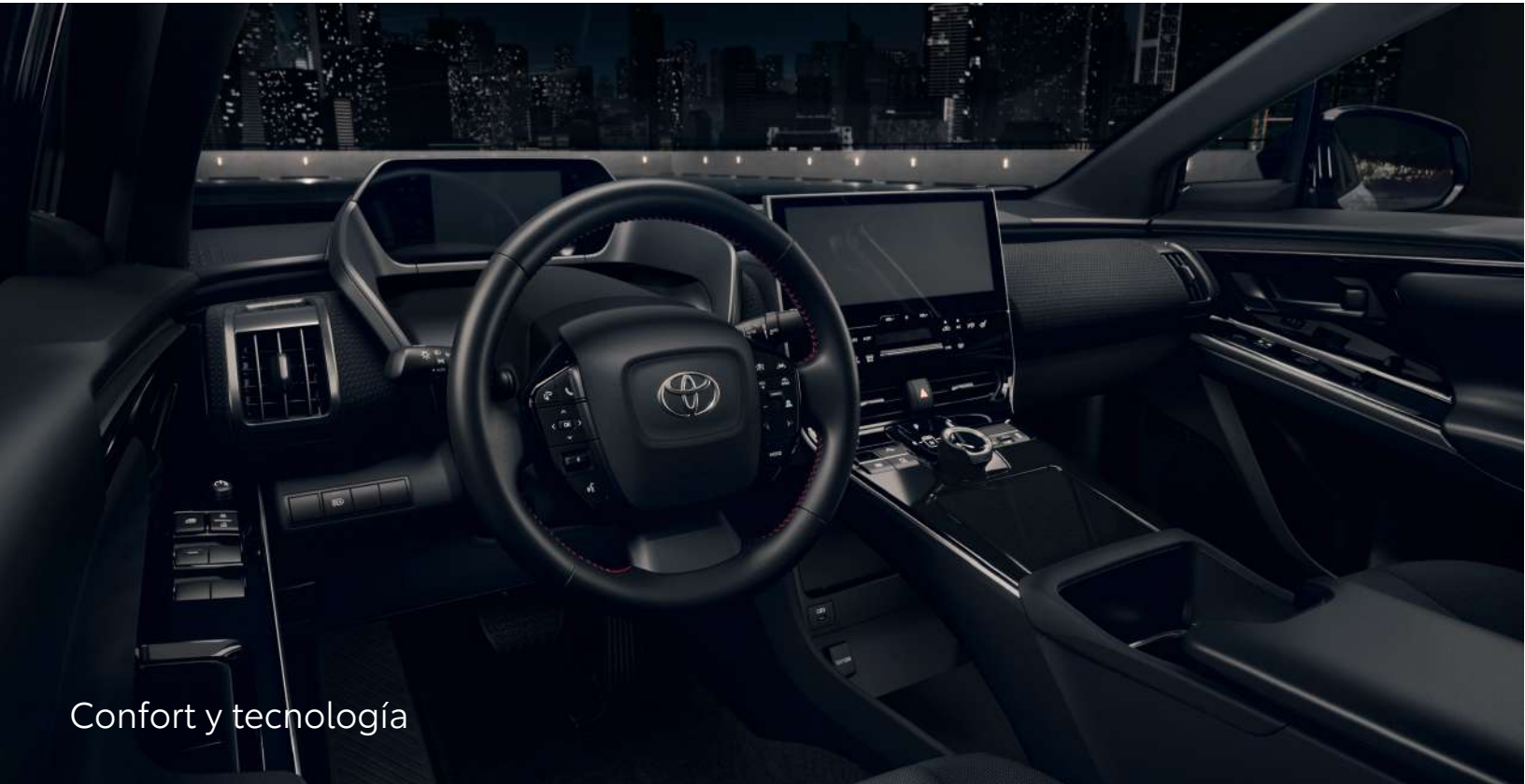
Confort y tecnología