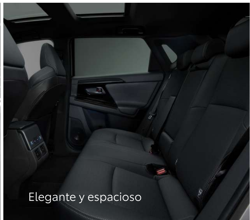
Elegante y espacioso